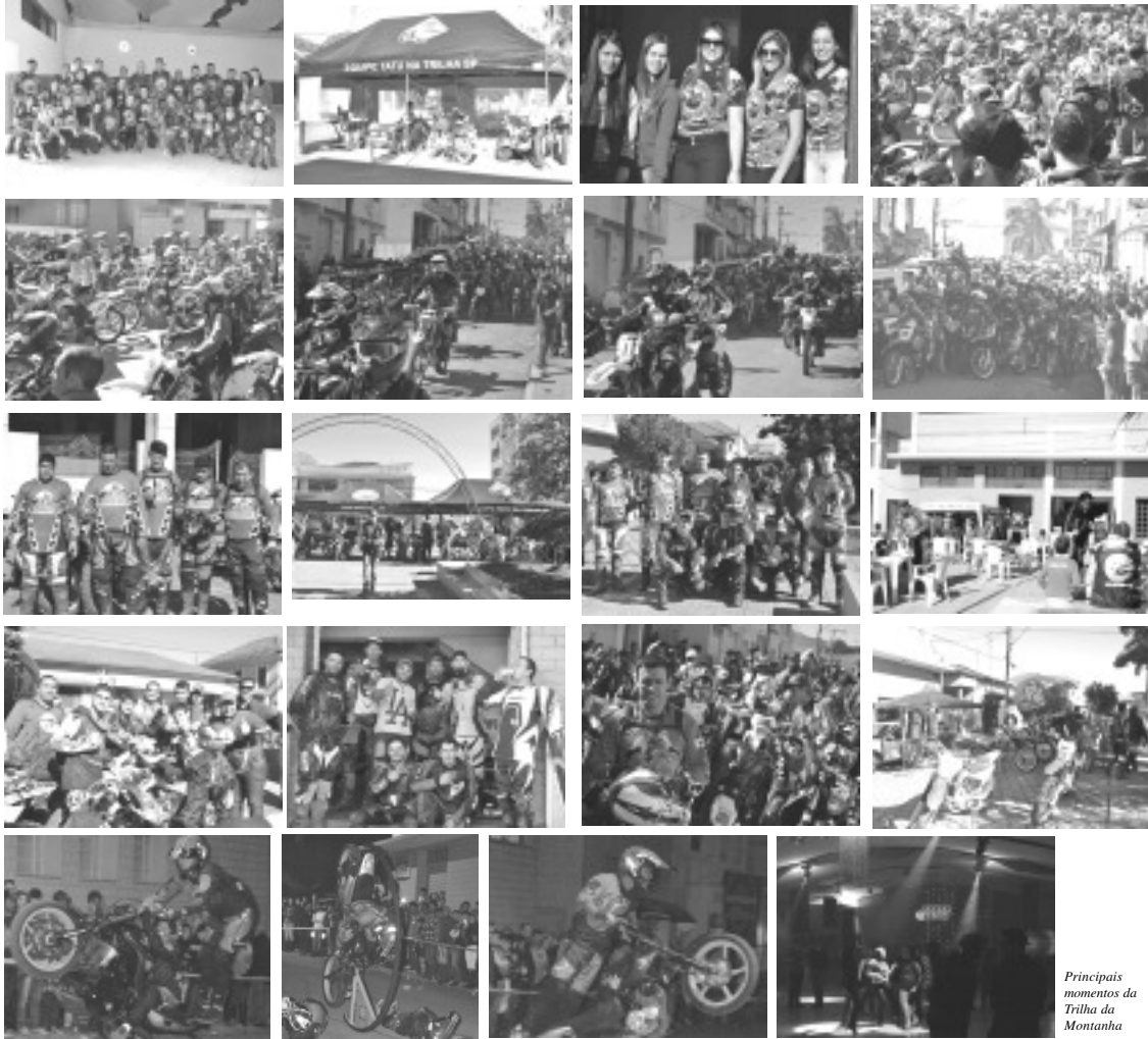
Principais momentos da Trilha da Montanha

Para os primeiros 500 pilotos, houve kit com camiseta, almoço e troféu. "Houve vários desafios para a galera que gosta de adrenalina, novas trilhas e de volta ao desafio morro PESADELO", diz um dos organizadores que faz parte da Equipe Montanha Moto Trilha, responsável pelo evento, que agradece o apoio da Polícia Militar e dos comerciantes da cidade.