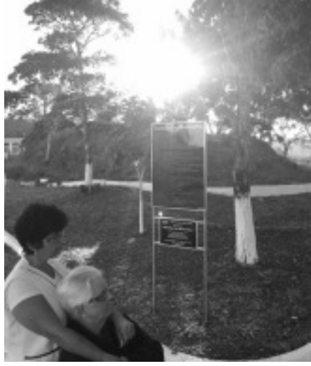
Inauguração do Sermão da Montanha