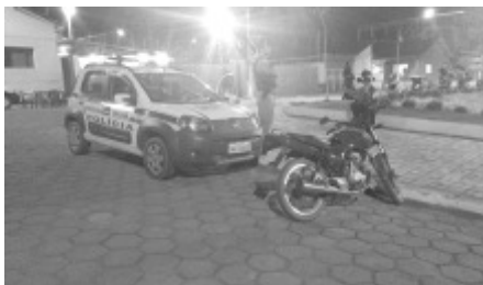
Moto apreendida no Distrito do Sertãozinho

Durante Operação no Distrito Sertãozinho, a equipe policial suspeitou de um condutor que dirigia a motocicleta sem o capacete. Diante de uma ação rápida, o condutor ficou impossibilitado de evadir dos Militares, sendo então abordado e constatado que o cidadão em tela estava com sinais de ter ingerido bebida alcoólica, sendo convidado a se submeter ao teste Etímetro, contudo recusou-se. Verificou-se também que o condutor é habilitado na categoria C, não portava nenhum documento de porte obrigatório, a motocicleta estava sem lacre, sem a seta traseira direita, e com os pneus carecas. Diante do exposto, foram lavradas 05 atis e o veículo removido pelo guincho de Plantão.