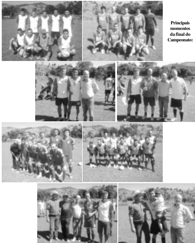
Principais momentos da final do Campeonato: