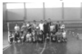
Escolinha de Voleibol em Borda da Mata

A escolinha é uma parceria com o Departamento de Esportes, Cultura e Laser e da Prefeitura e as inscrições podem ser feitas no local.