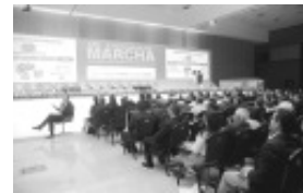
Reunião dos Prefeitos com o Presidente da CNM