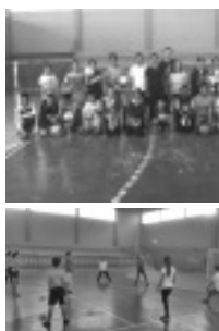
Escolinha de Vôlei em Borda da Mata Página 8

Borda da Mata agora tem Escolinha de Voleibol no Poliesportivo