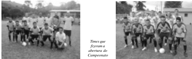
Times que fizeram a abertura do Campeonato