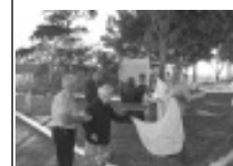
Desceramento da Placa Comemorativa Página 3

Prefeitura de Borda da Mata inaugura Monumento “Sermão da Montanha”