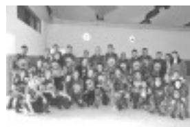
Trilha movimentou a cidade nos dias 30 de abril e 1º de maio