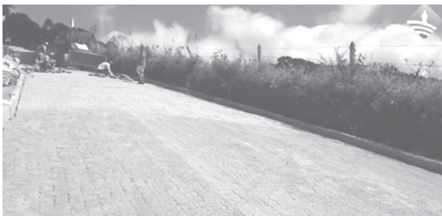
Morro do Nei

No cenário rural de Bom Repouso, um programa está causando um impacto significativo nas comunidades locais. O Programa Rotas do Produtor tem sido uma iniciativa vital na transformação dessas áreas, promovendo não apenas a conectividade física, mas também fortalecendo os laços sociais e econômicos entre os bairros. Recentemente, dois trechos importantes foram finalizados, pavimentando o caminho para uma melhor integração entre os moradores. O trecho pelo Morro do Nei, que liga o bairro Cantuários ao bairro Caetanos, e o trecho pelo Morro do João Rufino, também conectando Cantuários e Caetanos, são agora pontos de acesso mais seguros e eficientes para a comunidade. Além desses avanços, uma das mais recentes conquistas do programa é o