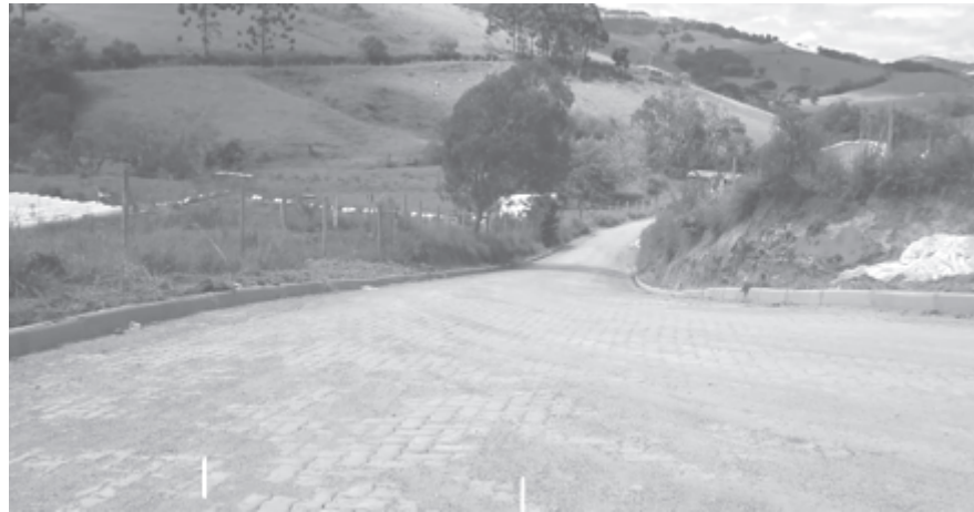
Morro João Rufino