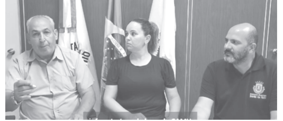
Prefeito, Vice e Secretária de Saúde durante assinatura do Termo de Compromisso de Infraestrutura

https://bordadamata.mg.gov.br/.../unidade-de-suporte.../