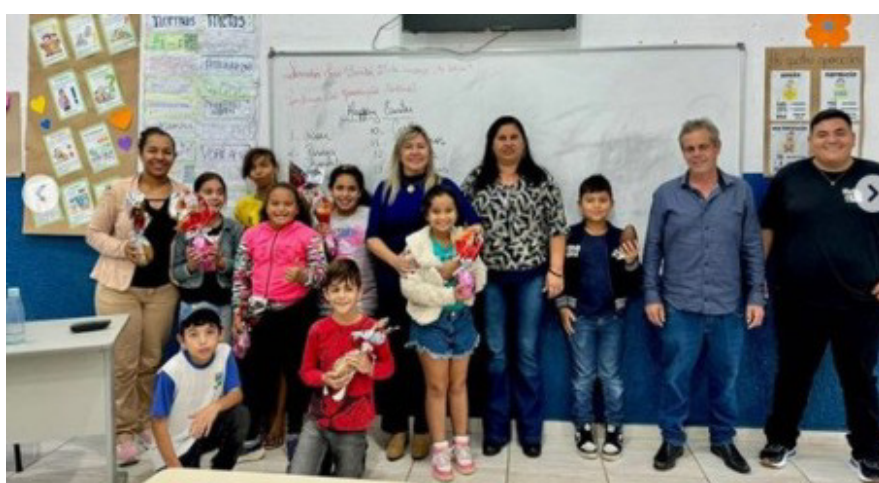
Entrega dos Ovos de Páscoa

Alunos da Rede Municipal de Ensino de Senador José Bento ganham Ovos de Páscoa