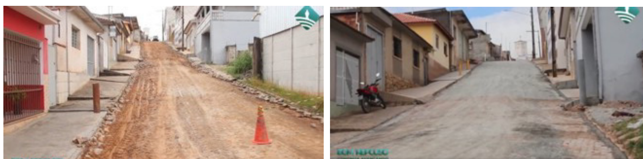
Revitalização da Rua José Messias Sobrinho

Revitalização da Rua José Messias Sobrinho em Bom Repouso promove qualidade de vida e segurança