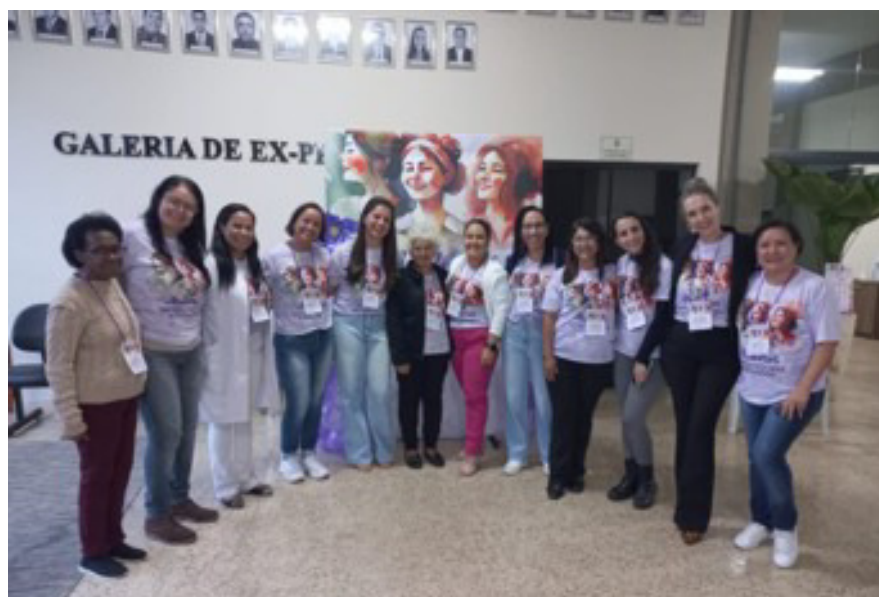
Evento de Mulheres Empreendedoras

Câmara Municipal de Borda da Mata celebra o Mês das Mulheres com Evento de Mulheres Empreendedoras e Palestra sobre Saúde Mental