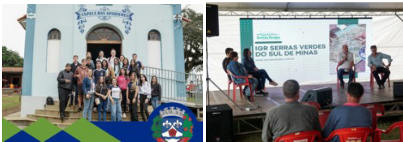
XI Jornada de Turismo promovida pelo Circuito Serras Verdes do Sul de Minas

Estudantes de Tocos do Moji participam da XI Jornada de Turismo promovida pelo Circuito Serras Verdes do Sul de Minas em Congonhal