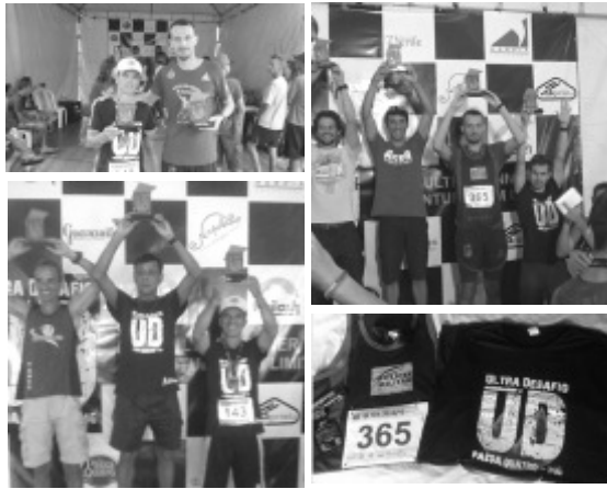
Entrega da premiação em Passa Quatro

Durante entrega dos troféus as autoridades presentes exaltaram Tocos do Moji como cidade propícia de "celeiro de corredores de montanha", parabenizando-os.