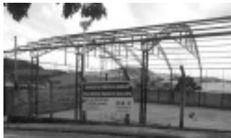
Cobertura da Quadra da Escola do Nossa Senhora de Fátima