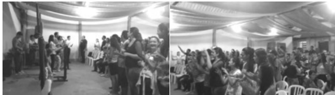
Encerramento do Cerco de Jericó

é aberta de segunda a Sexta das 08h às 17h e todo dia com uma programação especial e toda última quinta feira do mês temos uma noite especial de reavivamento e encerramento do Cerco de Jericó", diz um dos participantes.