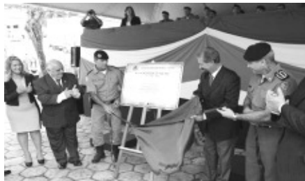
Solenidade de inauguração da 12ª Cia PM em Ouro Fino

Com esta Companhia Independente instalada em Ouro Fino, as cidades de Borda da Mata, Monte São, Jacutinga, Inconfidentes, Bueno Brandão, Albertina, Munhoz e Tocos do Moji, passam a fazer parte de uma nova Unidade com status de Batalhão, deixando de serem subordinadas ao 20º Batalhão da Polícia Militar em Pouso Alegre e estando subordinadas diretamente a 17ª Região de Polícia Militar.