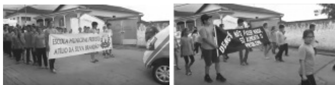
Estudantes durante passeata pelas ruas da cidade