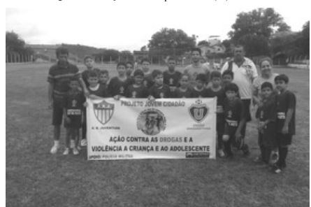
Escolinha no Distrito do Sertãozinho