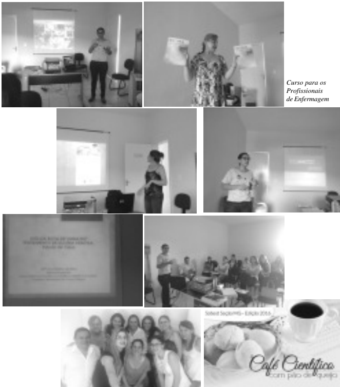
Curso para os Profissionais de Enfermagem

Devido ao crescente avanço científico na área de curativos é sempre necessária a atualização dos profissionais possibilitando conhecimento teórico sobre os estágios da cicatrização de feridas permitindo assim a escolha do curativo adequado para cada tipo de lesão, favorecendo o tratamento aos pacientes melhorando a qualidade de vida dos mesmos.