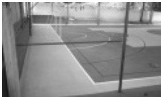
Pintura da Quadra da Escola do Bairro Santa Cruz