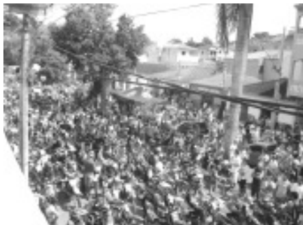
Milhares de pessoas e muitas motos, gaiolas e jeeps na Trilha da Torre