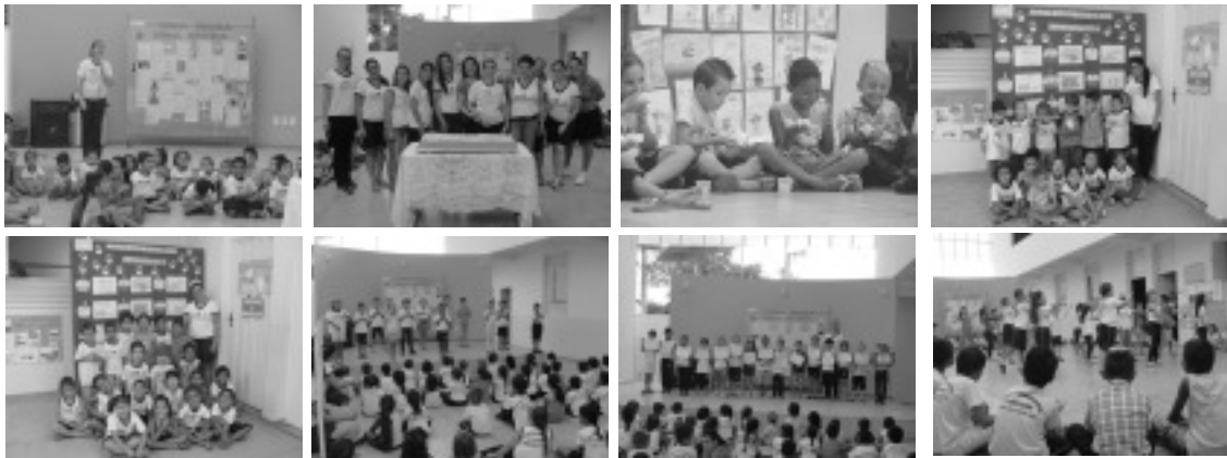
A escola do bairro Santa Cruz em Borda da Mata completou 72 anos no dia 26 de março. Os professores e alunos prepararam trabalhos com a história de fundação da escola, fizeram apresentações de danças e poesias, além de cantar parabéns e comer bolo no dia 27/03/2017. Parabéns Escola Municipal Antônio Marques da Silva!