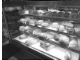
Padaria Primor em Pouso Alegre