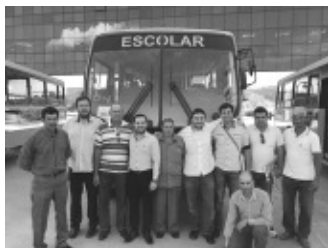
Grupo de Bom Repouso recebendo os ônibus