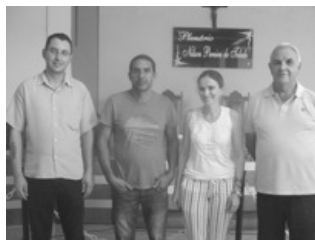
Diretoria Conselho Municipal da Criança e do Adolescente de Borda da Mata