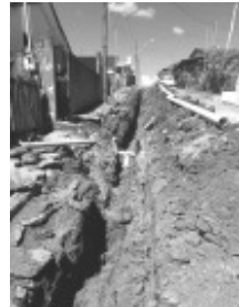
Problema da Rede de Esgoto no Distrito do Cervô resolvido no final de semana