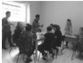
Oficina de artesanato no bairro Santa Cruz

No dia 07/04 começou a oficina de artesanato na Unidade Básica de Saúde (UBS) do bairro Santa Cruz em Borda da Mata. As atividades são ministradas pela equipe do programa Estratégia Saúde da Família e são abertas aos moradores da comunidade. A oficina vai acontecer toda sexta-feira, às 8h30 na UBS do bairro.