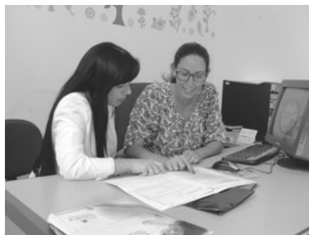
Vigilância Sanitária atuando na prevenção de riscos à saúde da população

coordena o programa de zoonoses, em que os cães de rua estão sendo vacinados e vermifugados, em parceria com as ONGs de defesa dos animais e a clínica veterinária São Francisco.