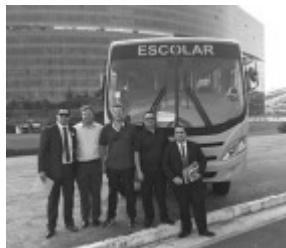
Grupo de Borda da Mata recebendo o ônibus