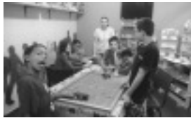
Serviço de convivência com as crianças

No anexo Santa Cruz, os serviços acontecem na terça e quarta, de manhã e tarde. Os encontros tiveram início em 6/04/2017.