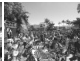
Largada da Trilha da Torre