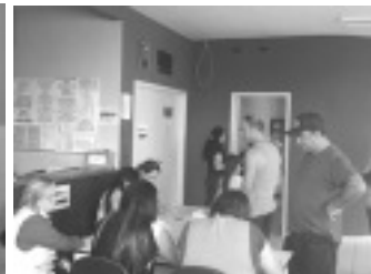
Vacinação contra a Febre Amarela em Borda da Mata