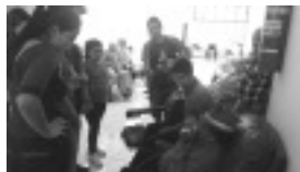
Visita dos jovens ao Lar Monsenhor Pedro Cintra

A Prefeitura de Borda da Mata agradece à catequese e ao grupo JORAC pela atenção com os senhores e senhoras que vivem no Lar.