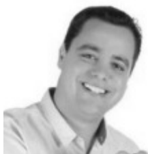
Borda da Mata André do Tipão 5.054 votos