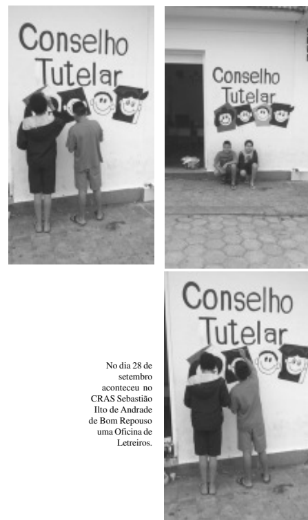
No dia 28 de setembro aconteceu no CRAS Sebastião Ilio de Andrade de Bom Repouso uma Oficina de Letreiros.