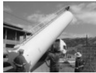
Reservatório de água do Distrito do Cervo