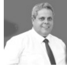
Senador José Bento Fernando 1.011 votos

Confira o resultado das eleições na Página 5