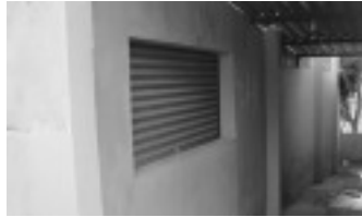
Posto de Saúde do Barro Amarelo

A Prefeitura de Borda da Mata, através do Departamento de Obras, executou uma melhoria com reforma e pintura no Posto de Saúde do Barro Amarelo. Outra obra que será feita no Barro Amarelo em novembro é o calçamento do bairro. Já foi feita abertura de crédito suplementar para o processo ser finalizado e a licitação será feita no início de novembro com cronograma físico e financeiro de 45 dias.