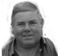
Bom Repouso Messias 4.719 votos