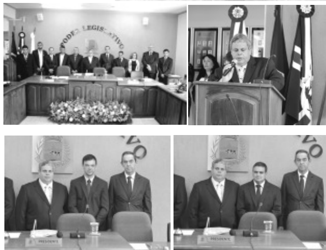
Solenidade de posse em Senador José Bento