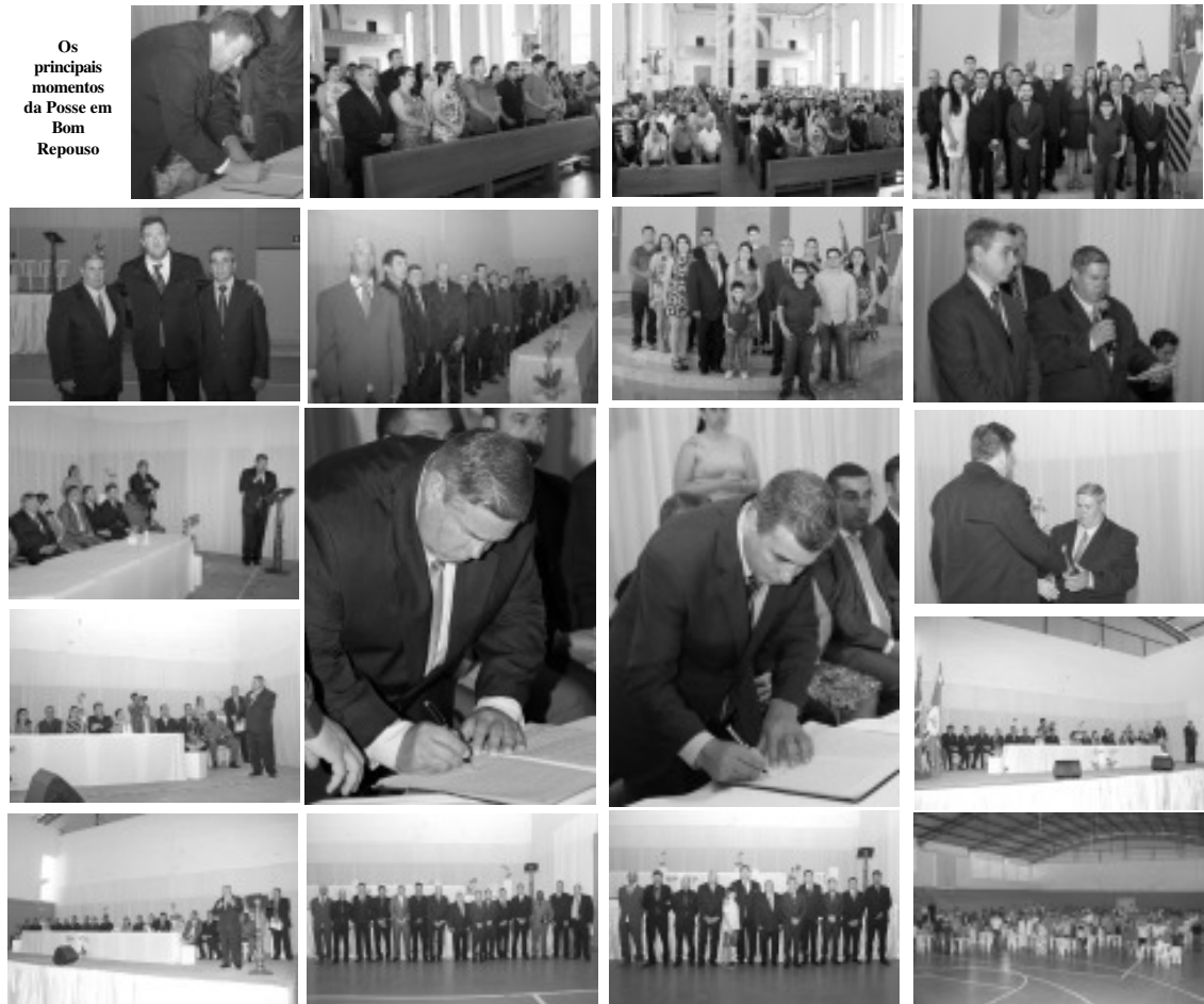
Os principais momentos da Posse em Bom Repouso