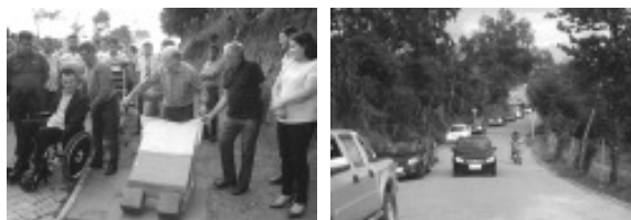
Inauguração do calçamento do Distrito Fernandes