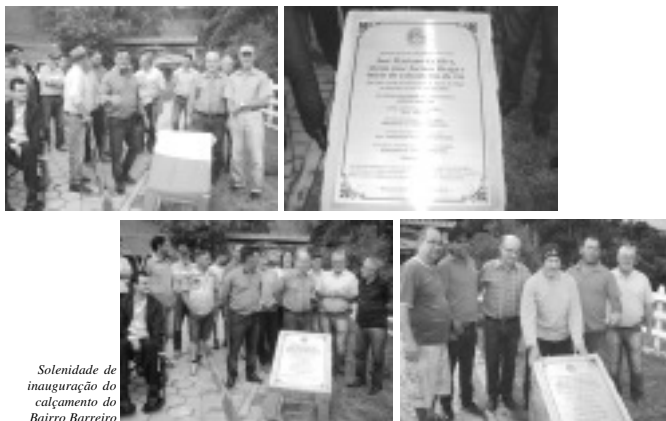
Solenidade de inauguração do calçamento do Bairro Barreiro

obra de calçamento era um sonho antigo e um desejo de todos, visto que, a população sofria muito com muita lama no verão e poeira no inverno, e agora não terão mais essa problemática. Outro fator positivo é a comodidade no tráfego e também a valorização de todos os imóveis do setor.