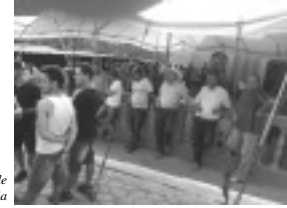
Festividades de Santa Luzia