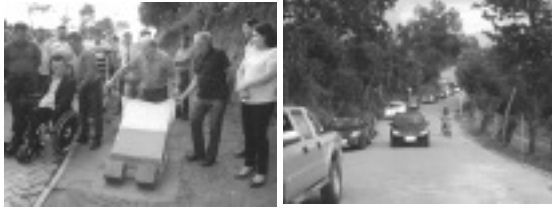
Solenidade de inauguração do calçamento entre Tocos do Moji e Fernandes

A Prefeitura de Tocos do Moji, apesar da crise em que se encontra o país, vem realizando muitas obras entre elas estão a construção de pontes, reformas de escolas e de quadras poliesportivas, pavimentação de ruas do Município, Bairros e Distritos.