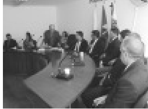
Solenidade de posse em Tocos do Moji