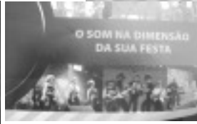
Festa de Aniversário de Tocos do Moji