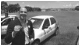
Entrega do carro pelo Governador em São Sebastião do Paraíso