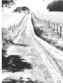
Estrada bem conservada