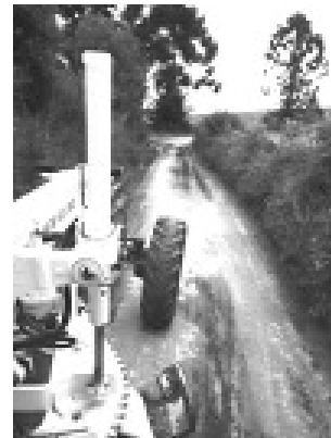
Alto do Serro