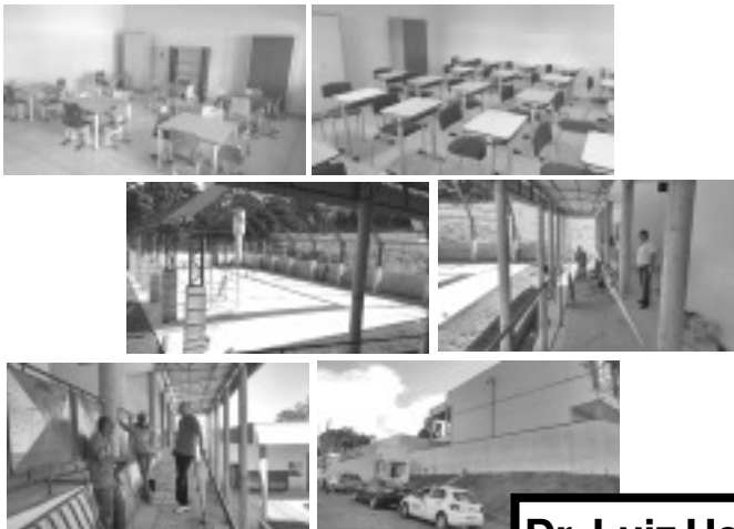
Escola Professora Diva Ribeiro dos Santos no bairro Santa Rita ampliada e totalmente reformada