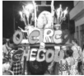
Principais momentos do Carnaval de Tocos do Moji