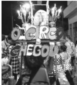
Desfile do Chuchu Beleza