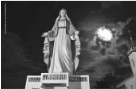
Nossa Senhora das Graças em Bom Repouso