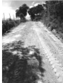
Boa Vereda de Cima