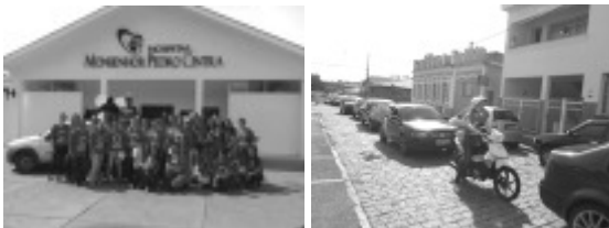
Mobilização feita pelos Funcionários da Saúde de Borda da Mata contra o mosquito Aedes Aegypti