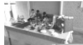
Flashes do Encerramento no Bairro Santa Cruz: