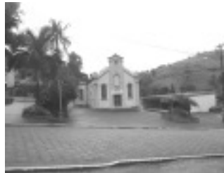
Sertão da Bernardina

Vereadores de oposição de Tocos do Moji impedem que Prefeitura receba através de empréstimo junto ao BDMG o valor de 800 mil reais