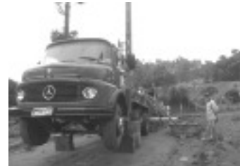
Calçamento no Bairro Barro Branco