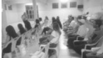
Palestra sobre Agrotóxicos

no manejo de agrotóxicos e descarte das embalagens salientando a importância da utilização dos EPIs (Equipamentos de Proteção Individual), orientou sobre os malefícios dos agrotóxicos para saúde e as morbidades ligadas a ele e demonstrou a maneira correta de lavagens dos alimentos para retirada dos produtos.