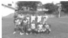
Nossa Senhora de Fátima