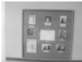
Memorial Nossa Gente