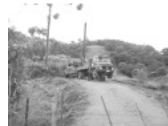
Construção do Poço Artesiano no Bairro Barro Branco

Outra obra que continua também no mesmo bairro é calçamento, que já está adiantado e, em breve, será entregue a população.