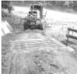
A Prefeitura de Bom Repouso continua firme na melhoria dos bairros da zona rural do município. Neste mês de novembro, a população que está recebendo este benefício é a do Bairro dos Bentos.