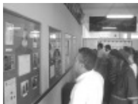
Visitantes no Memorial Nossa Gente