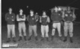
Polícia Militar e abaixo o Desfile dos Cavaleiros e dos Carros de Boi