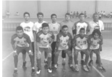
Escolinha de Futebol União Bordamatense

campeão, vice e terceiro lugar, tanto no futebol de campo quanto no futsal e também agora com o futebol feminino”, diz um pai de aluno.