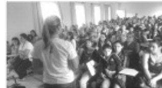
Palestra durante o “Outubro Rosa” em Tocos do Moji

Ginecologista da Unidade de Saúde, para as mulheres do Município. A palestra abordou temas de prevenção relacionado ao câncer de mama, câncer de colo de colo de útero, exames realizados, medidas preventivas, tratamento e mitos e verdades sobre saúde da mulher.