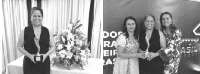
Solenidade de premiação do Gestor Nota 10

Parabéns a todos e todas! Secretaria Municipal de Educação