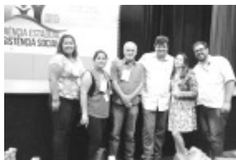
Conferência Estadual de Assistência Social