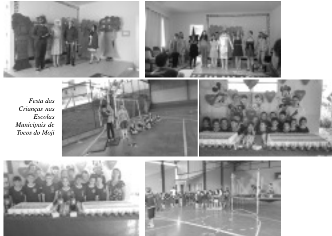
Festa das Crianças nas Escolas Municipais de Tocos do Moji