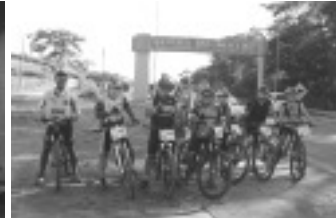
Etapa do Circuito Brasileiro do Ciclismo