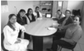
Capacitação para os funcionários da UBS Santa Rita

Durante o pós-parto, a mulher passa pelo período puerpério em que o corpo feminino experimenta modificações físicas e psíquicas. Este é o tempo que decorre até que os órgãos reprodutores da mãe retornem ao seu estado antes da gravidez. A preocupação com a saúde e bem-estar da mãe e também do recém-nascido