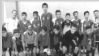
Futsal Módulo I - EMBBC

nascidos em 2000, 2001 e 2002), a EELAM venceu nas três categorias: futsal, handebol feminino e handebol masculino. A etapa microrregional dos JEMG acontece em Extrema do dia 29/05 a 04/06.