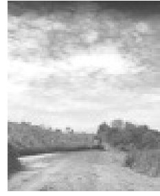
Estrada do bairro Fartura

Entre outras ruas do município que vem recebendo manutenção pela Prefeitura, no início do mês de maio, a Rua João Beraldo que liga o Centro ao bairro Santa Rita e a Avenida João Olivo Megale