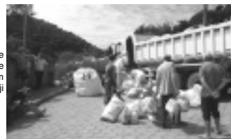
Coleta de embalagens de agrotóxicos em Tocos do Moji

Prefeitura de Tocos do Moji realiza Coleta Itinerante de Embalagens de Agrotóxicos em todo Município