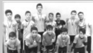
Handebol Masculino Módulo I - EMBBC