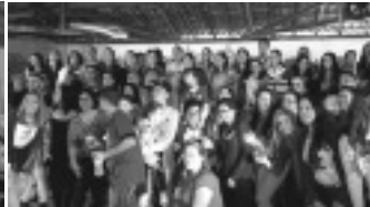
Reunião da Família Braga de Tocos do Moji