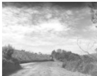
Estrada do Bairro Fartura durante manutenção