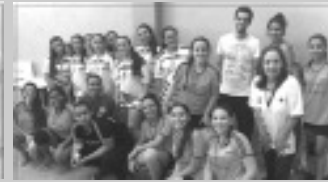
Handebol Feminino Módulo II - EELAM