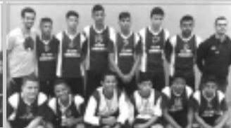
Futsal Módulo II - EELAM