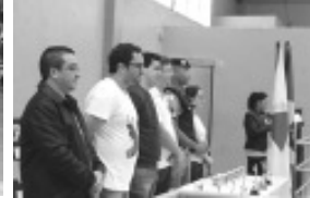
Etapa Municipal dos Jogos Escolares de Minas Gerais