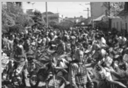
Largada na Praça Central Página 5

Trilha da Montanha em Bom Repouso reúne cerca de 500 pilotos