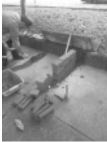
Banco estragado e já arrumado