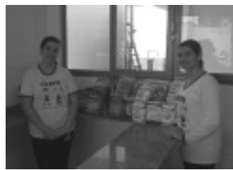
Alimentos arrecadados no rodeio

Os alimentos foram organizados por ordem de vencimento para atender a demanda de consumo e o estoque está gerenciado para atender as instituições a médio prazo.