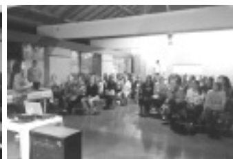
Treinamento das Serventes Escolares

GRÁFICA E JORNAL TRIBUNA POPULAR - 3445-2130