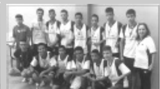
Handebol Masculino Módulo II - EELAM