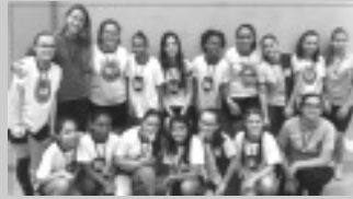
Handebol Feminino Módulo I - EMBBC