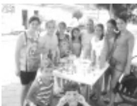
Projeto desenvolvido em Tocos do Moji