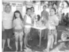
Projeto de Artesanato em Tocos do Moji

T e x t o : V a n d e r l e i C a r l o s d a S i l v a