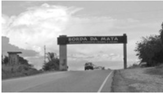
Entrada da cidade que será iluminada

desenvolvimento da cidade, já que a maioria dos comércios que levam o nome do município para todo o país, se encontra neste trecho e além do mais, são milhares de veículos que passam diariamente por Borda da Mata e com a iluminação, além de atrair mais pessoas, oferece mais segurança aos usuários.