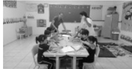
Entrega das apostilas para 2016 em Tocos do Moji

Os alunos da Educação Infantil da Rede Municipal de Educação de Tocos do Moji receberam da Prefeitura as apostilas para o ano letivo de 2016. As apostilas foram adquiridas através de recursos próprios da Prefeitura. O Departamento Municipal de Educação agradece ao Prefeito Toninho Rodrigues pelo carinho que tem com a Educação em Tocos do Moji.