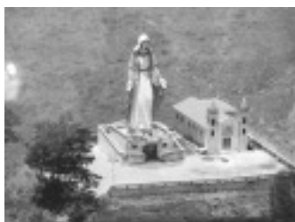
Parque Nossa Senhora das Graças